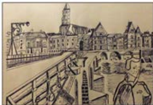
Dessin réalisé par Alicia Bonnet, adhérente de l'atelier dessin de la MJC